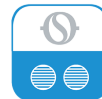
Olympia Splendid Unico

TOWER slechts 18,5 cm bedraagt, zal het apparaat niet snel "in de weg zitten" in de ruimtes waar de Tower wordt geplaatst. De geluidsproductie is zonder meer bescheiden en de bediening is eenvoudig en logisch. Naast de bijgeleverde functionele afstandsbediening kan de Unico Tower tegen meerprijs, net als alle andere Unico modellen overigens, worden bediend middels de (gratis te downloaden) Olympia Splendid App.